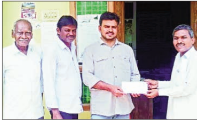
వికలాంగులకు తప్పనిసరి ఐదు శాతం రిజర్వేషన్ కల్పించాలని ఆయన కోరారు. వికలాంగులకు అందించే పరికరాలతో పాటు ప్రతి నెల అందించే ఆసరా పెన్షన్లను 4వేల నుండి 6వేలు పెంచి